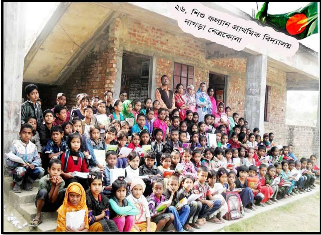
শিশু কল্যাণ প্রাথমিক বিদ্যালয়-২৬, নেত্রকোনা