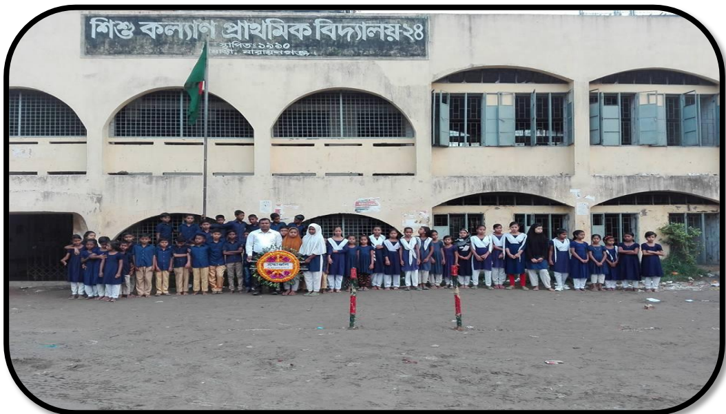
শিশু কল্যাণ প্রাথমিক বিদ্যালয়-২৪, চাষাড়া, নারায়ণগঞ্জ